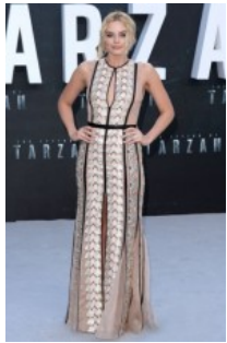
Los 10 mejores looks - semana del 4 de julio ver ▶